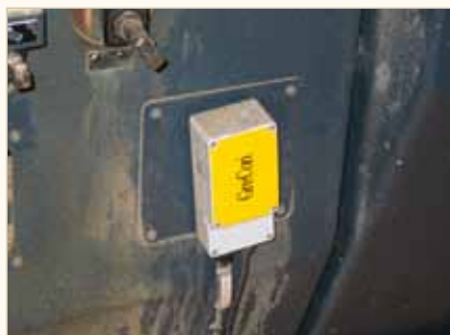
überwachter Innenraum des Hobels

Mit Hilfe einer GreCon-Brandfrüherkennung, gekoppelt mit automatischen Löschanlagen, kann diesen Brandgefahren wirksam begegnet werden. Neben der Funkenlöschung in den Absaugleitungen wird ebenfalls in der Hobelkabine oder auch in den Abdeckhauben des Hobels sowie im unteren Maschinenbett mit einer Wasserlöschung gearbeitet, die sich durch einen minimalen Wasserverbrauch durch eine neue Wassernebeltechnik auszeichnet.